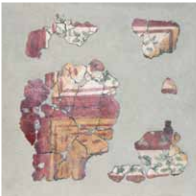
Geometrikus motívumokkal díszített falfestmény, 4. század Szabadbattyán, a késő római épület perisztíliumának északi részéből