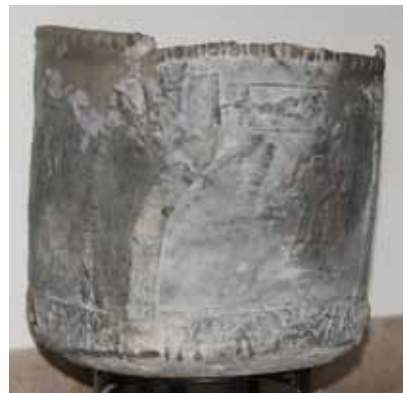
Ólomtartály vadászjelenettel és istenek ábrázolásával, 4. század Szabadbattyán, feltehetően az épület területéről került elő 1974-ben