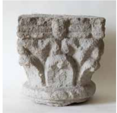
Leveles oszlopfő, 4. század Szabadbattyán, a késő római épület perisztíliumának oszlopsorából