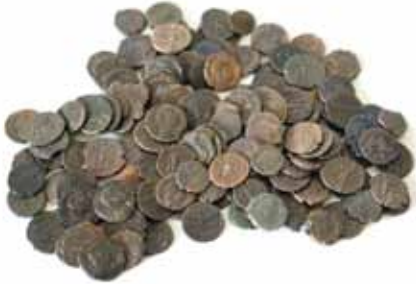
Éremlelet, 4. század második fele Szabadbattyán, a késő római épület, a csarnok padlójának feldúlt részéből

A légi felvételek, műszeres felmérések, felszíni nyomok alapján Szabadbattyán határában nagy kiterjedésű római kori település helyezkedett el, amelyet a Sárvíz összekötött a Duna vízi útjával.