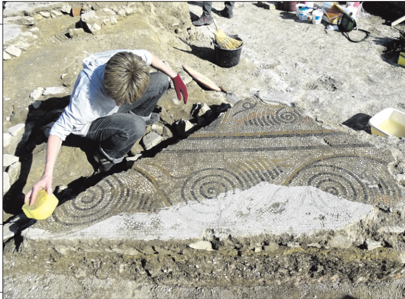
Az apszismozaik keretmotívumának egyik, eredeti helyzetében megőrződött darabja

A Seuso kutatási program elején ezért egy olyan lelőhelyet kellett keresnünk, amelynek feltáráásával megcáfolhatjuk a külföldi kollégáink által képviselt elutasító véleményt, és egyúttal bizonyítani tudjuk, hogy Pannoniában igenis jelen volt az a művelt és gazdag birodalmi elit, amely egykor a Seuso-kincshez hasonló minőségű ezüstedényeket tartott. Amely megértette az elit klasszikus műveltségre épülő irodalmi és vizuális kultúráját, és beszélt annak kifinomult nyelvén. Ezt a kettős célt egy olyan luxusvilla feltáráásával lehetett elérni, ahonnan a Seuso-ezüstöknek megfelelő minőségű, témájú és velük „azonos nyelvet beszélő” művészi alkotások előkerülésére számíthattunk. Magyarországon egyelőre a nagyharsányi villa az egyetlen ilyen jellegű biztos pont. Reményeinkben nem is kellett csalatkoznunk, sőt, az előke-