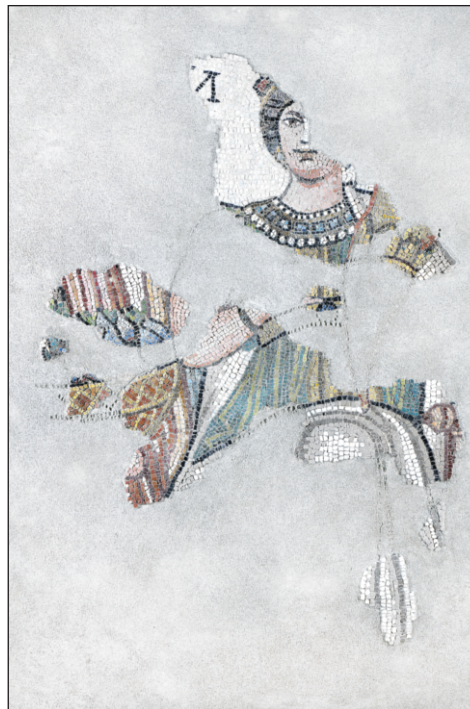
A Római Birodalom egyik nagyvárosát megszemélyesítő városistennő a nagyharsányi villa lakomatermének mozaikjáról

Nagyharsányban már a 60-as évek elején zajlottak ásatások, a Nemzeti Múzeum főigazgatójának, Fülep Ferencnek a vezetésével. Ezek során egy csodás fürdőház került elő. 1974-ben a központi épület területén a helyi tévesz szőlőt akart telepíteni,